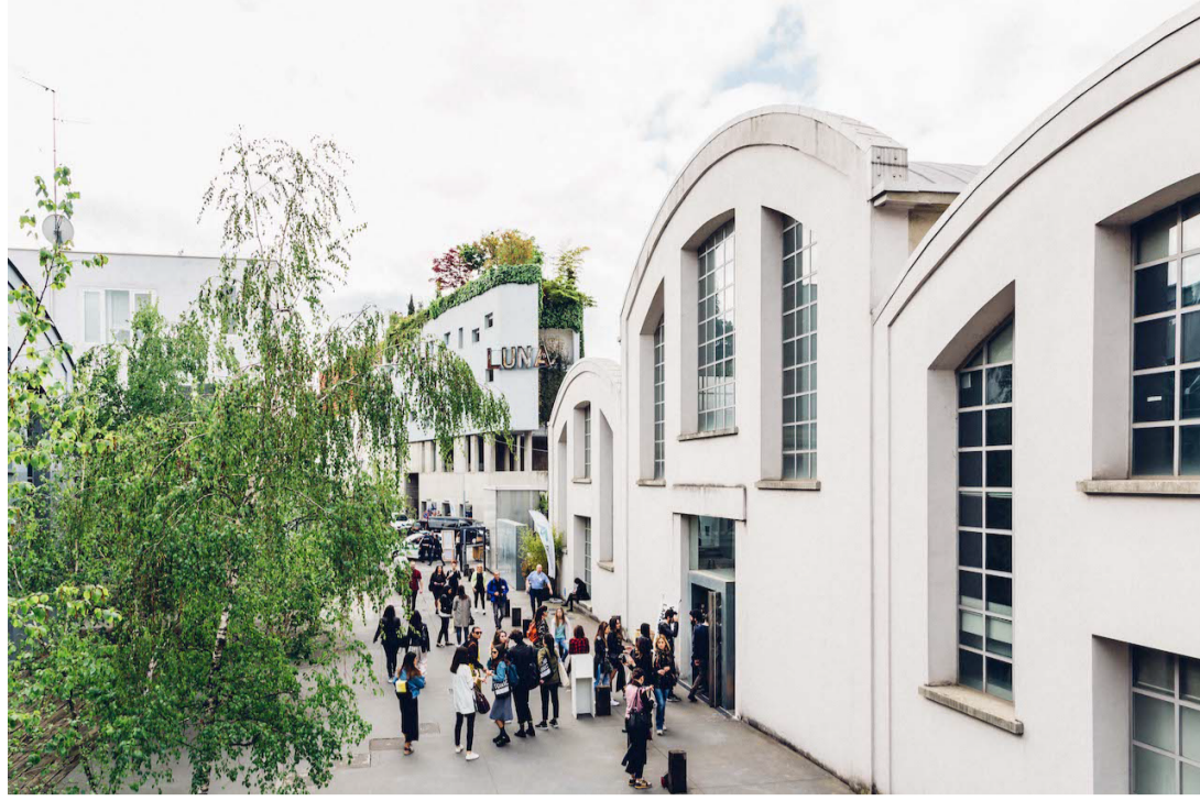
Scuola Mohole

Il design sostenibile, l'industria e la creatività saranno protagonisti nel Lambrate District durante la MDW 2019.